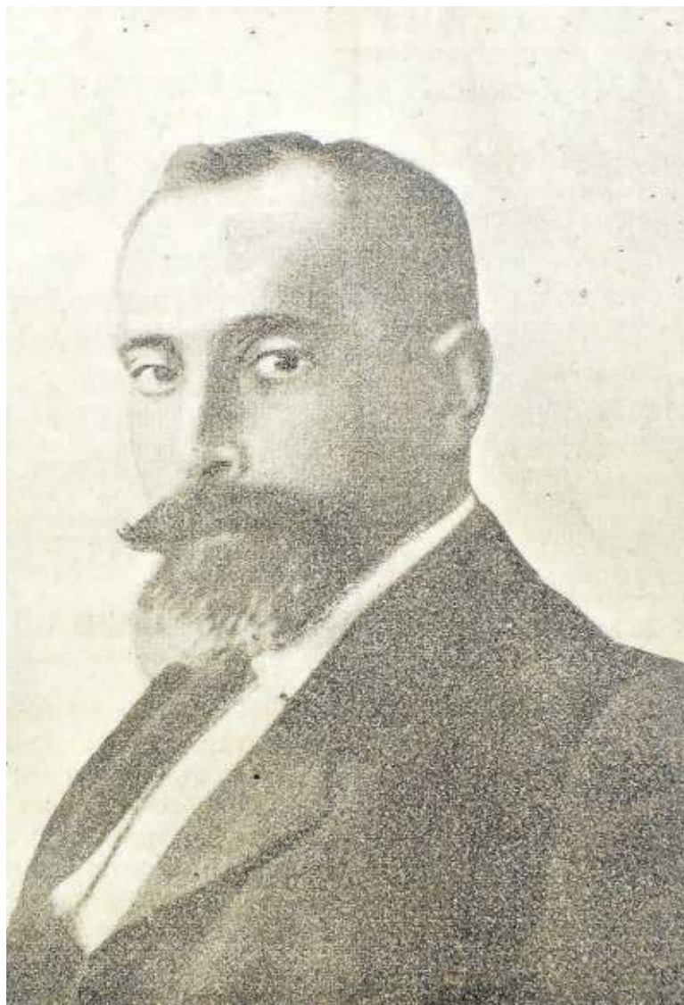
Retrato de Sabino Arana.