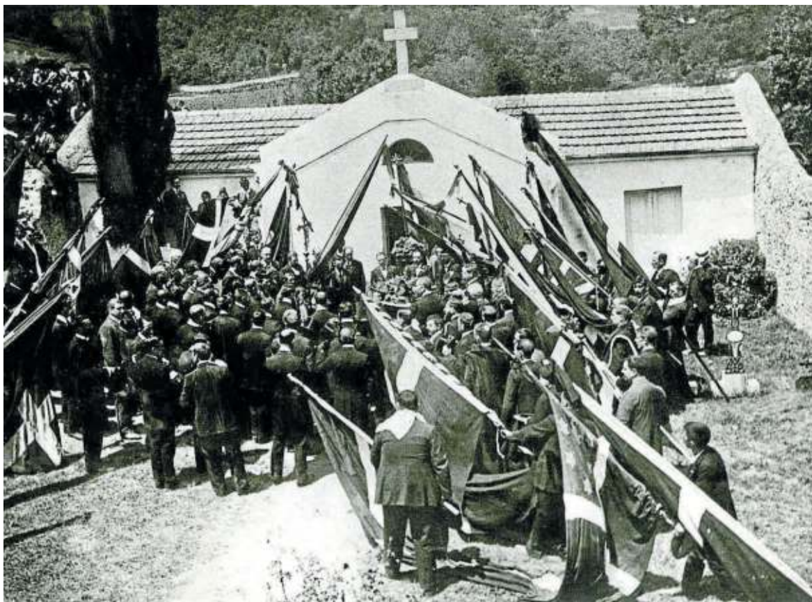
Asistentes al homenaje junto a la tumba de Sabino Arana.

A diferencia de las opiniones anteriores, según el semanario Aberrri —nacido en Bilbao en mayo de 1906 y que era el periódico oficial de EAJ-PNV— no importaba que la tumba de Sabin estuviera sola, sencilla e ignorada, si en cambio, los seguidores de Arana practicasen su doctrina. En dicho contexto, el Centro Vasco de