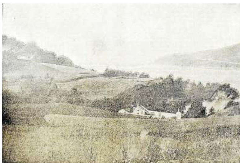
Cementerio de Sukarrieta en 1907.