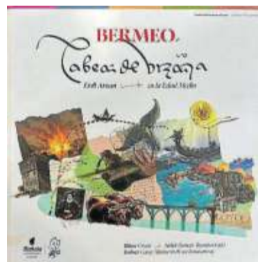
Catálogo de la exposición 'Bermeo, Cabeça de Vizcaya, Erdi Aroan / En la Edad Media'.