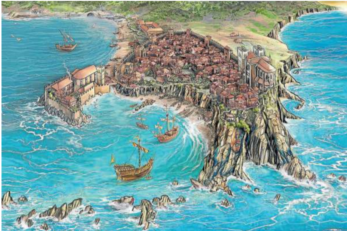
Recreación ilustrada del Puerto Chico de Bermeo, 'Portugitxia'.