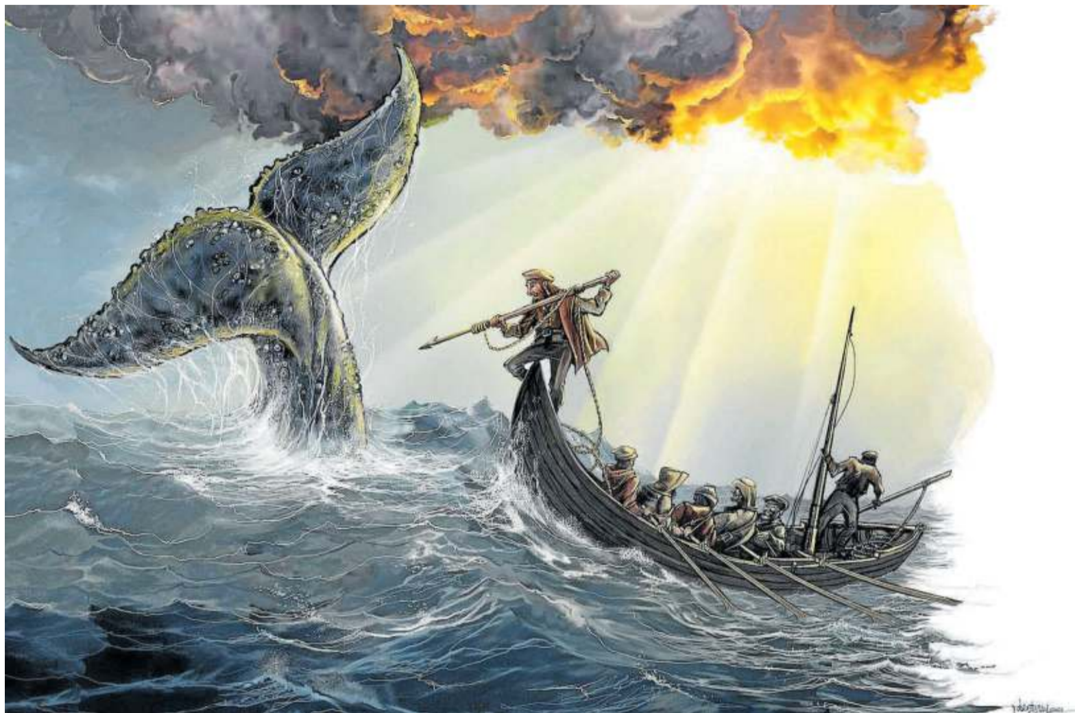
Recreación ilustrada de la caza de la ballena. Ilustraciones: Rober Garay

La pujanza de Bilbao y la conjunción de diversos factores internos contribuyeron a la progresiva pérdida de influencia de Bermeo desde mediados del siglo XV