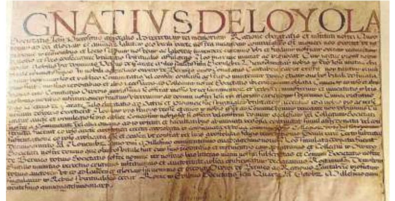
Patente de fundación del Colegio de Jesuitas en Bermeo otorgada por Ignacio de Loyola con su firma autógrafa (Archivo del Santuario de Loyola. Original en pergamino. 550 x 650 mm.).