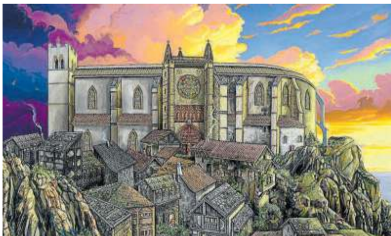
Recreación ilustrada de la iglesia de Santa María de la Atalaya.