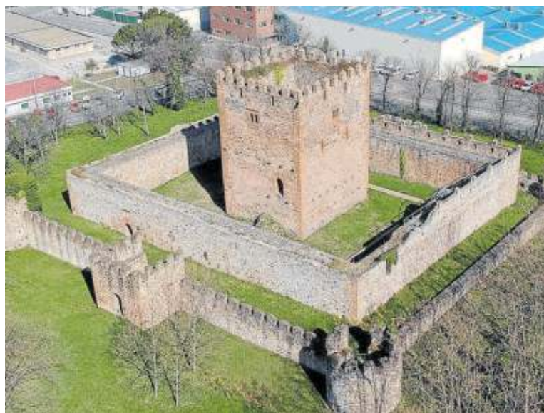
Castillo de Muskiz: una torre rodeada por dos líneas de murallas, por lo que se considera castillo desde el punto de vista arquitectónico.

Es por ello que, con la finalidad de incentivar la imaginación y la investigación, hemos retomado y madurado un estudio que preparamos hace varios años con la ayuda carto-