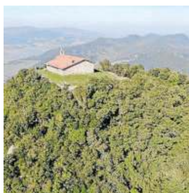
El castillo de Ereño se encontraba situado en la cumbre del Ereño-zar, y quedan los muros que cerraban el conjunto. Se situaba próximo al litoral.