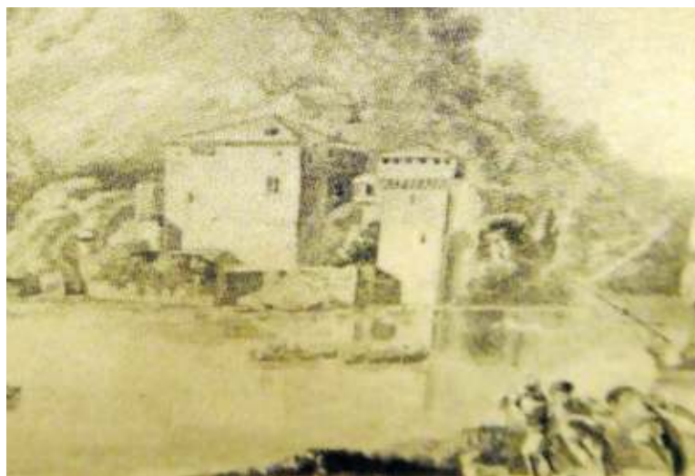
Castillo de Lutxana (Barakaldo), hoy desaparecido. Detalle de un dibujo de Luis Paret, de 1785.