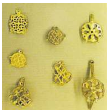
Arkeologia Museoa de Bilbao, apliques y otras ornamentaciones recuperadas en las excavaciones del castillo de Astxiki / Muntxiate, en Abadiño.

(Gaztelu, barrio, casas, 1563), Amoro-to, (Gazteluko Atxa, peña/colina), Arteaga-Arratia (Gaztelu, casa, 1456), Bedia (Gazteluzarra, colina), Berriz (Gaztelumendi, restos), Durango (Murugan, colina, restos), Garai (Illuntzar, restos), Larrabetzu (Gaztelu, varios topónimos, apellido 1511), Laukiz (Gazteluzarramendi, colina), Lekeitio (Palacio de los señores de Bizkaia, siglo XIV), Markina-Xemein (Gastelaitxu, colina), Muskiz (El Castillo, colina, 1767), Orozko (Larragorri, colina, restos medievales), Urduña (Gazteluzar, loma, restos), Zamu-dio (Gaztelumendi, monte), Zeanuri (Askastillo, peñas, leyenda) y Zornotza (Gaztelugana, colina).