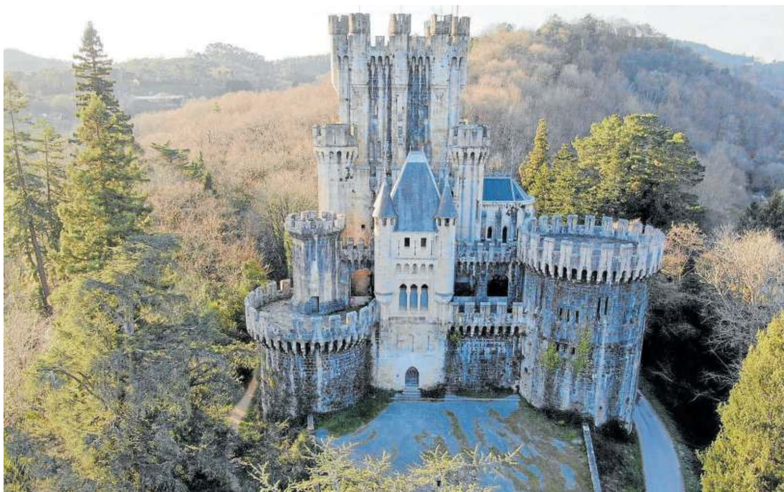
Fachada principal del castillo de Butrón, desde un dron.