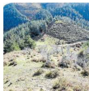
Bedia, Gazteluzarra o Kastillozarr. Colina cuyo nombre posiblemente registre la existencia de un castillo. El cordal donde está llega hasta el Gorbea.

En el caso de los topónimos, hasta donde llegan nuestros conocimientos, son anteriores a las cinco guerras que asolaron el territorio entre finales del XVIII hasta la última guerra carlista. Los restos de sus fortificaciones han tomado muchas veces el nombre de "gaztelu" o "castillo". Tampoco tienen como origen las baterías marítimas que el Consulado de Bilbao y el Señorío tenían y mantenían en todo el litoral desde finales del siglo XVI.