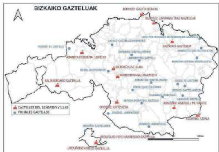
Bizkaia: distribución del los castillos del Señorío y de las villas, con un conjunto de posibles castillos.