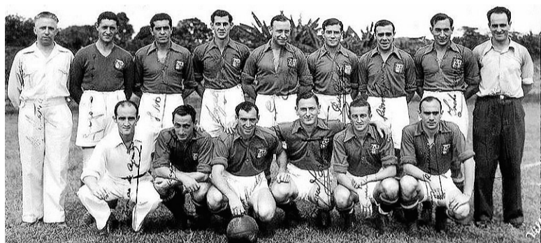
Arriba, la selección en Moscú y en México; a la derecha, cartel de Eresoinka y el grupo en París, en 1937.