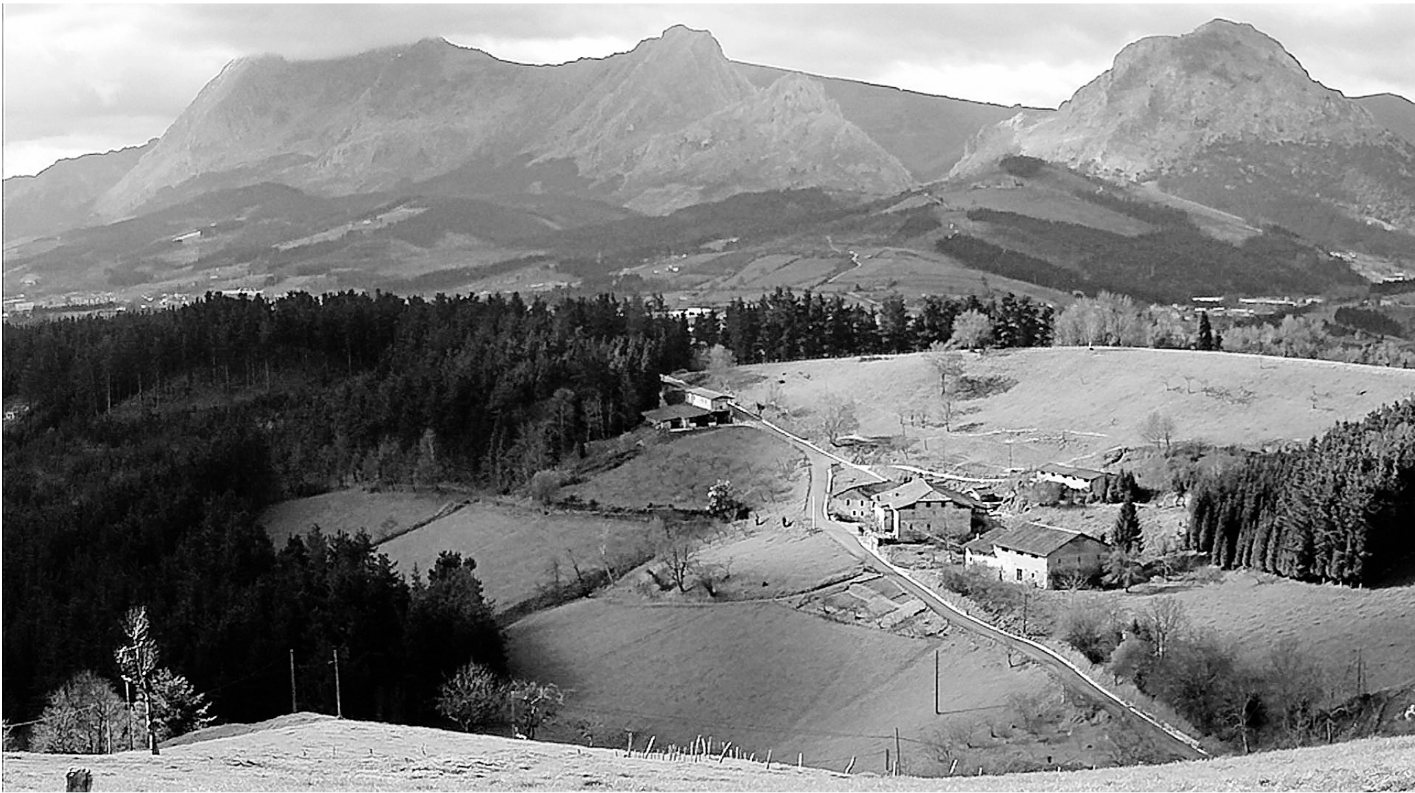
Vista general del barrio de Barrenkua de Garai.