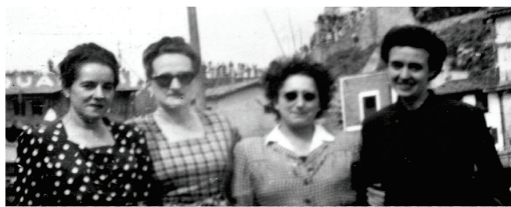
ERAKUSKETA Azaroaren 24tik abenduaren 16ra arte

Heren munduarentzat, deskolonizatzea aldarrikatzen du 1945eko udan. Orokorki populuen autodeterminazio eskubidearen alde dago, baina bemol garrantzitsu batekin: "Estatu mikroskopikoen ugaritzea ez du gustukoa, haien ezin bizia eta inperialismoen janizagatik". Aterabide federalistak nahiago ditu. Gandhi bezala, bortizkeriaren etsaia da, haatik ez osoki. Pazifismo hutsa arbuatzen du, populu borrokalarien jokoa egiten duelako. Gandhiren satia graha nekez onargarria zaio mundu mailan, gizona eta gizadia diren bezala ezagutuz. Munstroei bidea zabalik utz lezake. "1936an, Hitlerren aurka aski goizik mugitu gabe, gerlaren piztera bulkatu dugu". ●