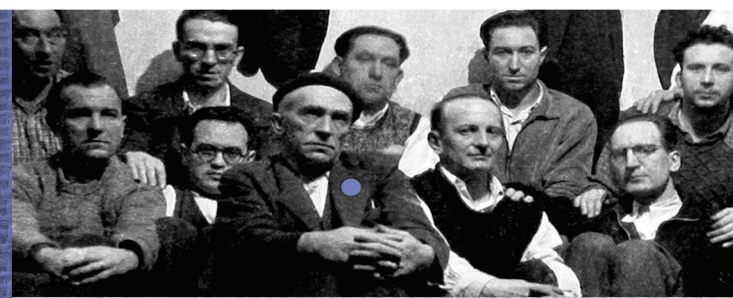
EXPOSICIÓN Del 24 de noviembre al 16 de diciembre

RED 1936-47 ALAVA SARBIA EMAKUME IKUSEZINAK MUJERES INVISIBLES ELKARTASUNA ETA ESPIOITZA SOLIDARIDAD Y ESPIONAJE