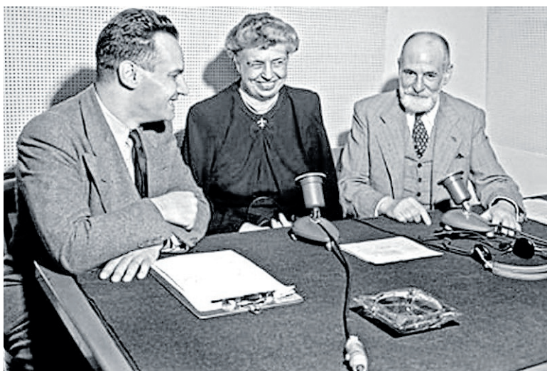
Eleanor Rooseveltek zuzentzen zuen Batzordeko kidea izan zen.

1908an zuzenbideko lizentzia lortzen du, baita historiakoa ere. Parisen