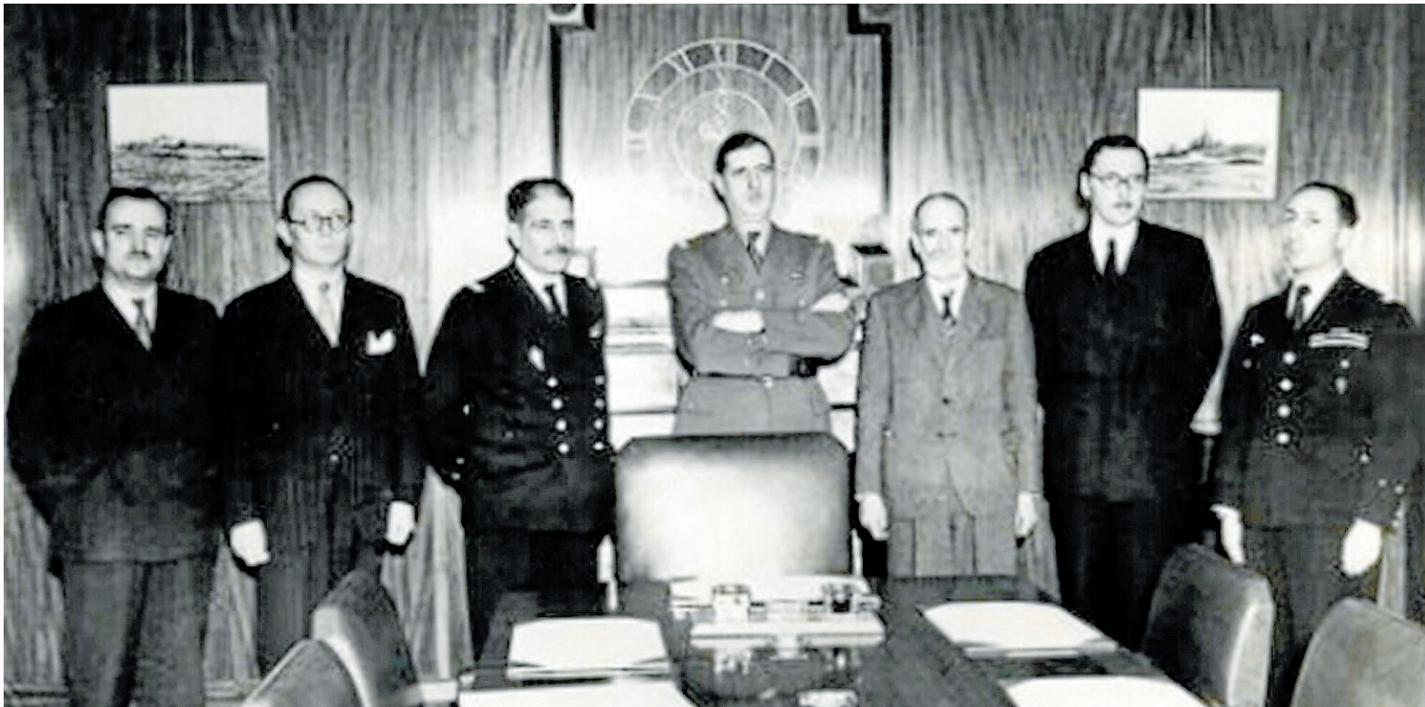
René Cassin Charles de Gaullek Londresen 1940an sortu zuen Frantzia Libreko kide izan zen.