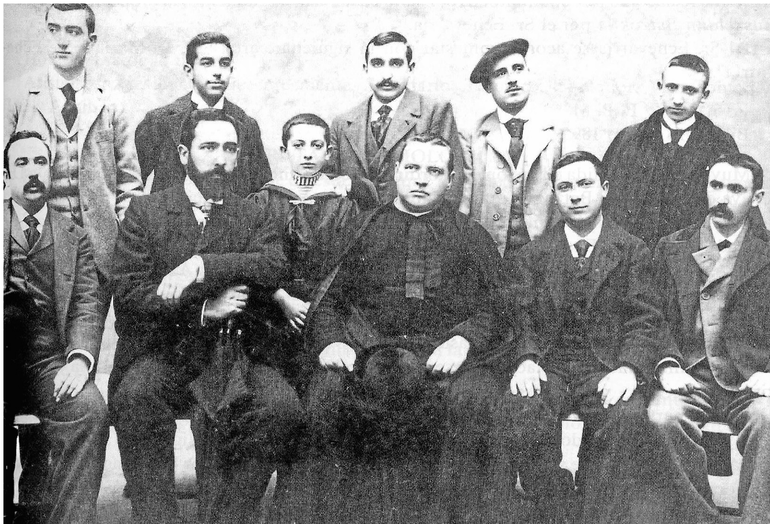
Sabino de Arana y Resurrección María de Azkue, junto a otros actores, en la representación de 'Vizcay'tik Bizkai'ra'.